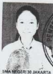
SMA NEGERI 30 JAKARTA